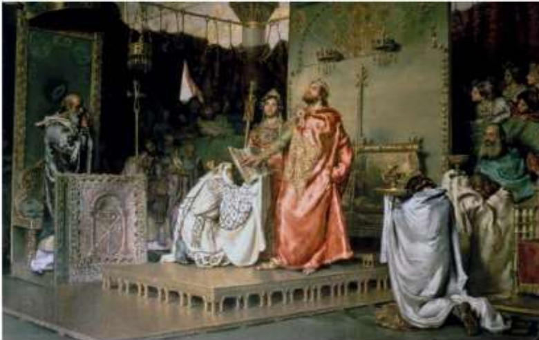
La Conversió de Recared, obra d'A. Muñoz Degrain (1888).

El 711, els visigots estaven enfrontats entre ells mateixos per la successió al tron. Els musulmans van aprofitar l'ocasió i van desembarcar al sud de la Península. Així va acabar el regne visigot a Espanya.